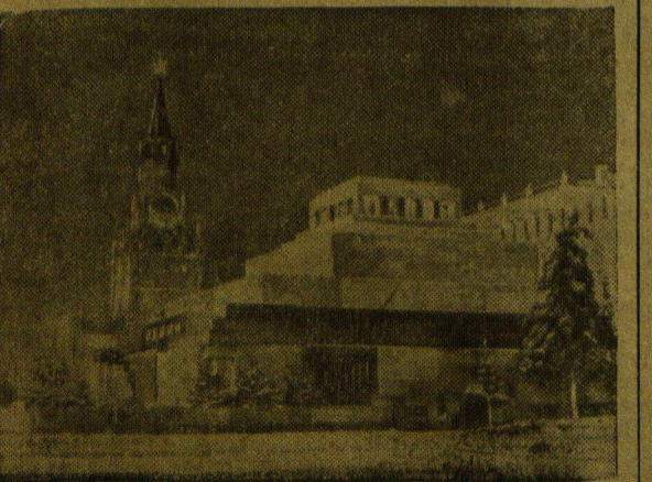
МОСКВА. Мавзолей Ленина ночью.

Ленинское учение озаряет немеркнущим светом путь советского народа к коммунизму, к счастливому будущему всего человечества. Ленин и Сталин учат советских людей никогда не успокаиваться на достигнутом. Под знаменем Ленина, под водительством товарища Сталина твердо и неуклонно идет наша Родина по ленинскому пути к полной победе коммунизма!