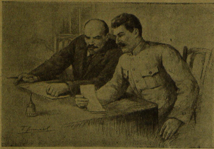
В. И. Ленин и И. В. Сталин. Рис. П. Васильева.

Билеты получить в отделе пропаганды и агитации горкома ВКП(б).